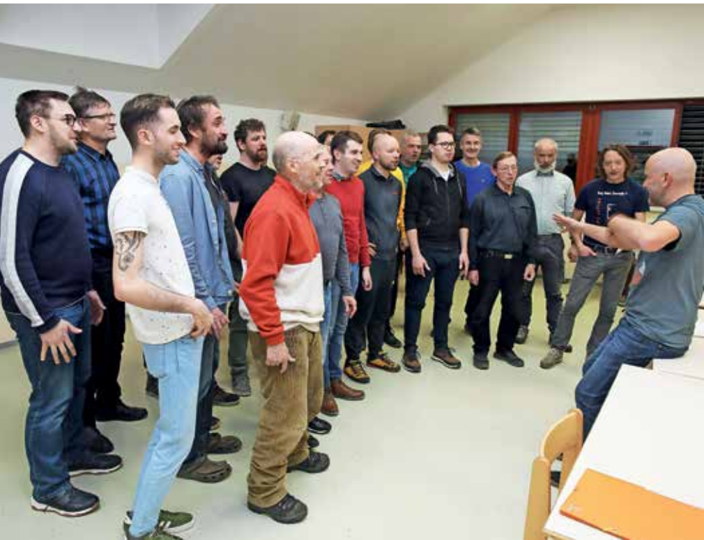
Moški pevski zbor Alpina praznuje šestdeset let ustvarjanja.