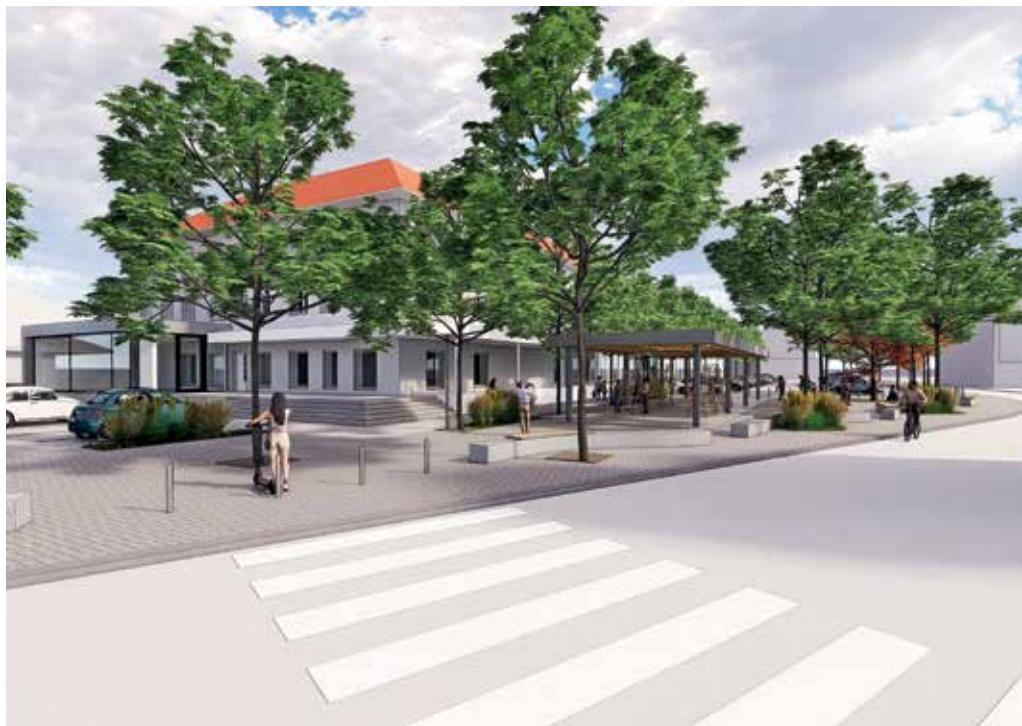
Projekcija ureditve središča Žirov