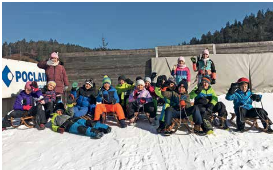
Športni dan 4. razreda Osnovne šole Žiri v NC Poclain