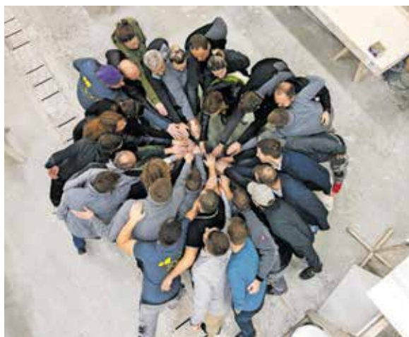
MARMOR HOTAVLJE, D.O.O., HOTAVLJE 40, GORENJA VAS, WWW.MARMOR-HOTAVLJE.SI